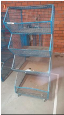
CARRO METÁLICO C/4 NICHOS EM AÇO CARBONO DIM 650X1600X690MM.