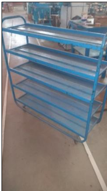
CARRO TIPO PLATAFORMA EM AÇO CARBONO DIM 1200X400MM ALT 1250MM C/5 PRATELEIRAS.