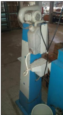
CANHÃO DE AR QUENTE MARCA ASSISTOCHE.