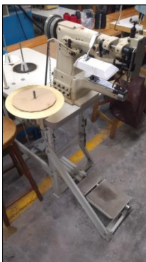
MÁQUINA DE COSTURA INDUSTRIAL MARCA LANMAX MODELO LM-335A.