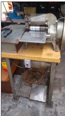
MÁQUINA DE CORTAR TIRAS EM AÇO CARBONO DIM 650X1250X500MM C/MOTOR ELÉTRICO POT 1/2 CV E ACIONAMENTO P/PEDAL MARCA ALFA.