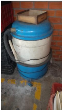
ASPIRADOR DE PÓ INDUSTRIAL EM AÇO CARBONO DIAM 700MM ALT 1050MM.