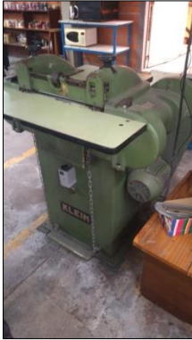
MÁQUINA DE DIVIDIR ANO 1984 EM AÇO CARBONO DIM 1000X1150X750MM C/MOTOR ELÉTRICO POT 1/2CV E COLETOR DE PÓ MARCA KLEIN.