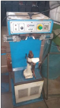
MÁQUINA DE FECHAR E REBATER MARCA SAZI MODELO 432.