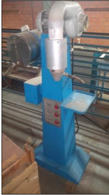
CANHÃO DE AR QUENTE MARCA ASSISTOCCHE.