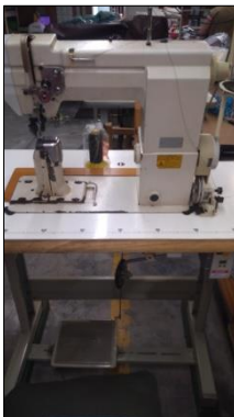
MÁQUINA DE COSTURA INDUSTRIAL MARCA BRUCE.