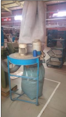
COLETOR DE PÓ C/VENTILADOR CENTRÍFUGO EM AÇO CARBONO DIAM 600MM C/MOTOR ELÉTRICO POT 1,5CV.