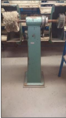
MOTO ESMERIL DE COLUNA C/2 REBOLOS DIAM 8" E MOTOR ELÉTRICO POT 1,5CV.