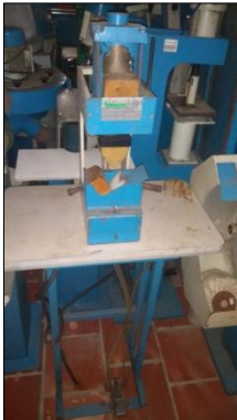
PRENSA HIDRÁULICA EM AÇO CARBONO DIM 450X1600X450MM C/ACIONAMENTO P/PEDAL MARCA HUNSEMAQ.