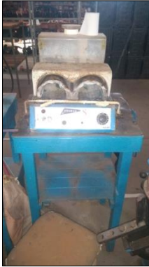
ATIVADORA MARCA MASTER MODELO S PALMILHA.