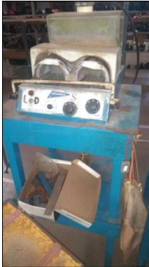
ATIVADORA MARCA MASTER MODELO S PALMILHA.