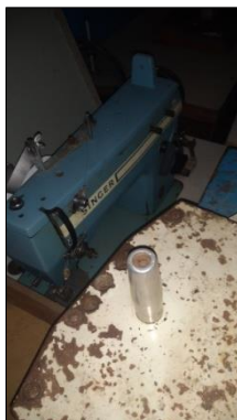
MÁQUINA DE COSTURA INDUSTRIAL MARCA SINGER MODELO 20V.