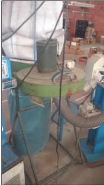
COLETOR DE PÓ C/VENTILADOR CENTRÍFUGO EM AÇO CARBONO DIAM 600MM C/MOTOR ELÉTRICO POT 1,5CV.