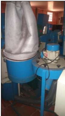
COLETOR DE PÓ C/VENTILADOR CENTRIFUGO EM AÇO CARBONO DIAM 600MM C/MOTOR ELÉTRICO POT 1,5CV.