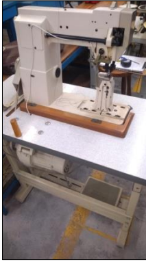
MÁQUINA DE COSTURA INDUSTRIAL MARCA SUN SPECIAL MODELO SS810W.