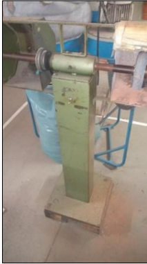
MOTO ESMERIL DE COLUNA C/1 REBOLO DIAM 6" E MOTOR ELÉTRICO POT 2CV.