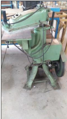
BALANCIM HIDRÁULICO MARCA METALÚRGICA AÇO REAL MODELO AM100.