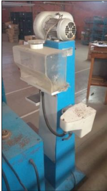
CANHÃO DE AR QUENTE MARCA MASTER MODELO TRM.