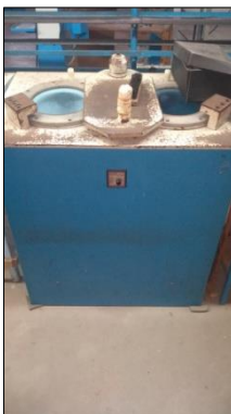
PRENSA SORVETEIRA EM AÇO CARBONO DIM 930X1000X570MM MARCA TELESOM.