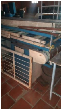
ESTEIRA TRANSPORTADORA DUPLA EM AÇO CARBONO DIM 12000X850MM ALT 950MMC/4 MOTORES ELÉTRICOS POT 15CV CADA.