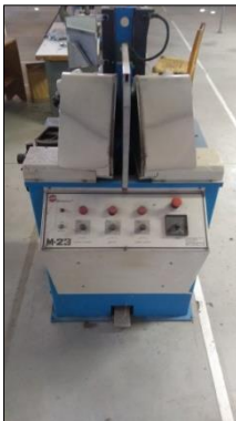
CONFORMADEIRA MARCA MORBACH MODELO M-23.