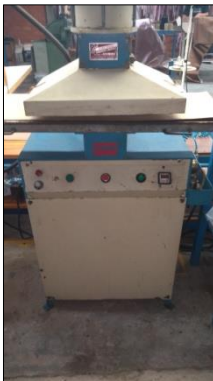
PRENSA PARA COURAÇA MARCA CONCÓRDIA.