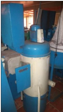
COLETOR DE PÓ MARCA MASTER MODELO DUST.