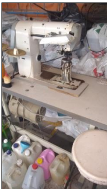
MÁQUINA DE COSTURA INDUSTRIAL MARCA PFFAF MODELO IMPEX.