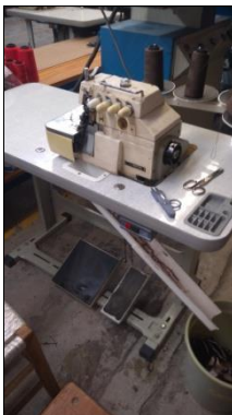
MÁQUINA DE COSTURA INDUSTRIAL MODELO BSS758G.