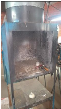
CABINE DE PINTURA EM AÇO CARBONO DIM600X600X600MM C/EXAUSTOR CENTRIFUGO DIAM 500MM.