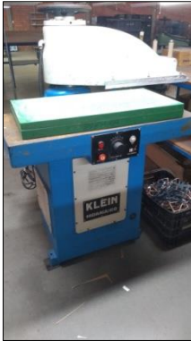
BALANCIM HIDRÁULICO MARCA KLEIN MODELO BHV22.