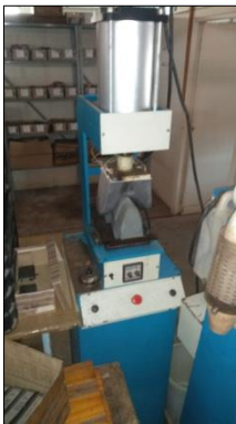
MÁQUINA DE FAZER CAMBRÉ MARCA LALOS METALÚRGICA.