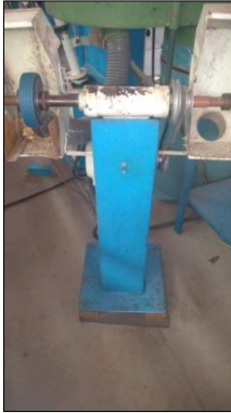
MOTO ESMERIL DE COLUNA C/1 REBOLO DIAM 6" E MOTOR ELÉTRICO POT 2CV.