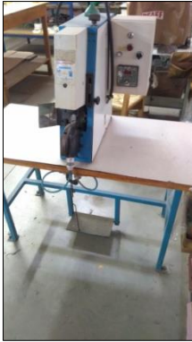
PRENSA HIDRÁULICA MARCA EDU MÁQUINAS.