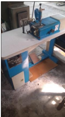
MÁQUINA DE CHANFRAR MARCA KLEIN MODELO CH-87.