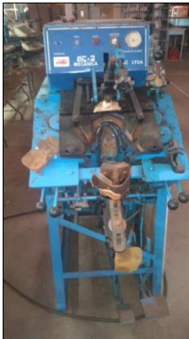
CONFORMADEIRA MARCA MCL MODELO MC-2.