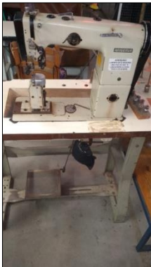
MÁQUINA DE COSTURA INDUSTRIAL MARCA MINERVA.