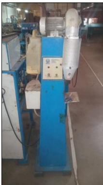
CANHÃO DE AR QUENTE C/MOTOR ELÉTRICO POT 1/3CV MARCA ASSISTOCICHE.