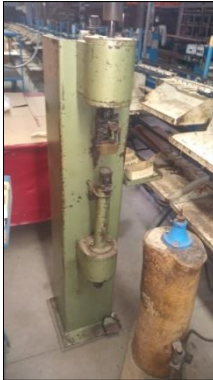
PRENSA HIDRÁULICA EM AÇO CARBONO DIM 450X1600X450MM C/ACIONAMENTO P/PEDAL.