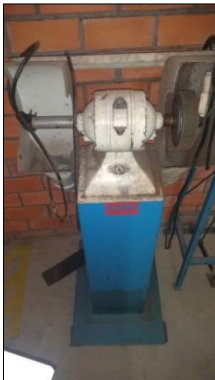
MOTO ESMERIL DE COLUNA MARCA CE MODELO 65/40.