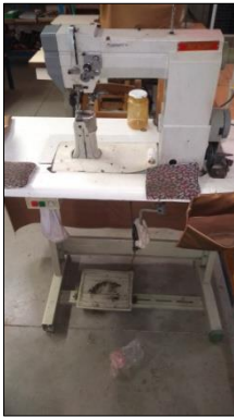
MÁQUINA DE COSTURA INDUSTRIAL MARCA NISSIN MODELO 591.