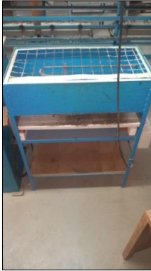
FORNO ELÉTRICO EM AÇO CARBONO DIM 800X1000X400MM C/2 RESISTÊNCIAS.