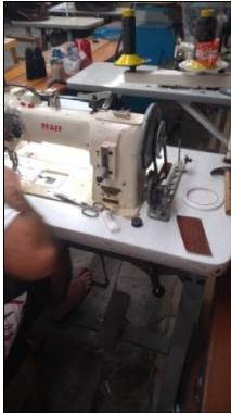
MÁQUINA DE COSTURA INDUSTRIAL MARCA PFFAF MODELO 471-755/01BL.