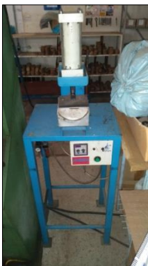
PRENSA PNEUMÁTICA MARCA EDU MÁQUINAS.