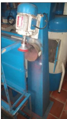
MÁQUINA BONECA EM AÇO CARBONO DIM 400X1600X400MM C/MOTOR ELÉTRICO POT 1/2CV.