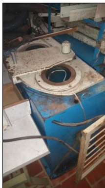
PRENSA SORVETEIRA EM AÇO CARBONO DIM 930X1000X570MM MARCA TELESOM.