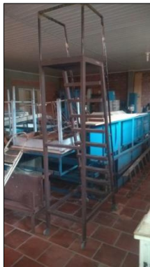
ESCADA MÓVEL EM AÇO CARBONO DIM 1100X2500X550MM C/10 DEGRAUS, PLATAFORMA, CORRIMÃOS E GUARDA CORPOS.