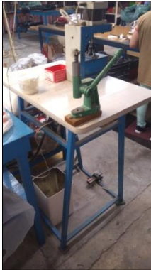
PRENSA PNEUMÁTICA EM AÇO CARBONO DIM 580X1600X580MM C/2 ATUADORES E ACIONAMENTO P/PEDAL.