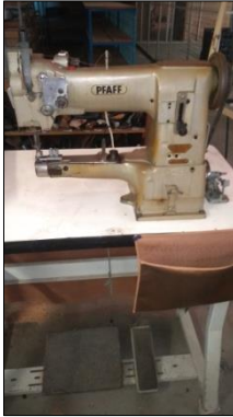
MÁQUINA DE COSTURA INDUSTRIAL MARCA PFAFF MODELO BLN.