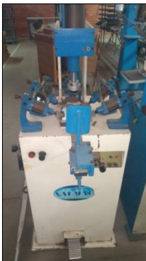
MÁQUINA DE REBATER PLANTAS MARCA VALMAC MODELO RPV II.