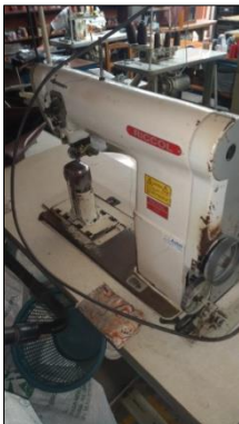
MÁQUINA DE COSTURA INDUSTRIAL MARCA RICCOL MODELO R-591.