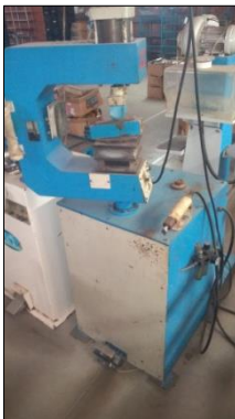
PRENSA PNEUMÁTICA EM AÇO CARBONO DIM 580X1600X580MM C/2 ATUADORES E ACIONAMENTO P/PEDAL.