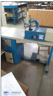
CHANFRADEIRA MARCA KLEIN MODELO CH90.