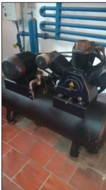
COMPRESSOR DE AR DIAM 550MM COMP 1600MM C/MOTOR ELÉTRICO POT 20CV E 3 CABEÇOTES MARCA DHB, CONSERVAÇÃO: BOM.