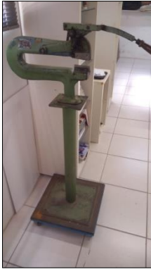
GUILHOTINA MANUAL MARCA HANS.