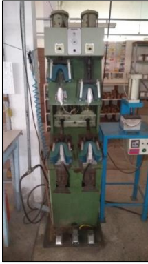
CONFORMADEIRA MARCA SEROTOM.