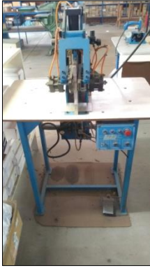
MÁQUINA DE FAZER CAMBRÉ MARCA JBM.