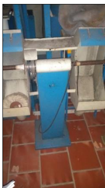
MOTO ESMERIL DE COLUNA C/2 REBOLOS DIAM 8" E MOTOR ELÉTRICO POT 1,5CV.