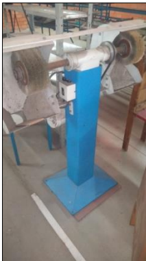
MOTO ESMERIL DE COLUNA C/2 REBOLOS DIAM 8" E MOTOR ELÉTRICO POT 1,5CV.