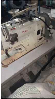
MÁQUINA DE COSTURA INDUSTRIAL MARCA PFFAF MODELO IMPEX.