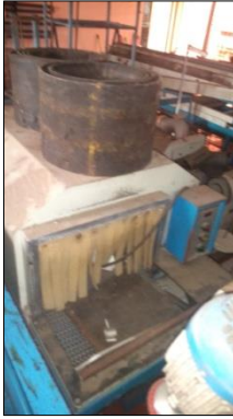
ESTUFA MARCA AJP MODELO AJP 650.