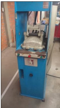
PRENSA HIDRÁULICA EM AÇO CARBONO DIM 450X1600X450MM C/ACIONAMENTO P/PEDAL.